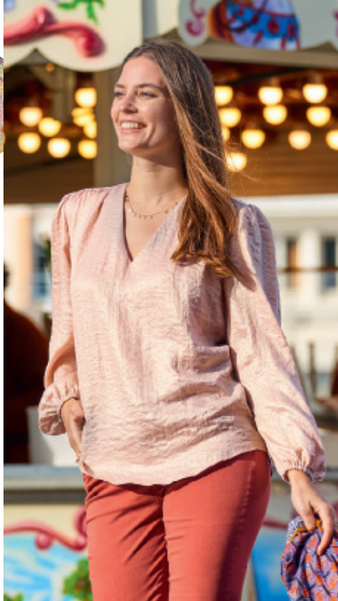
La blouse DINAN Réf 850138.08 Taille 38 à 50 : 59 €